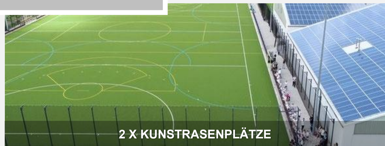
2 X KUNSTRASENPLÄTZE