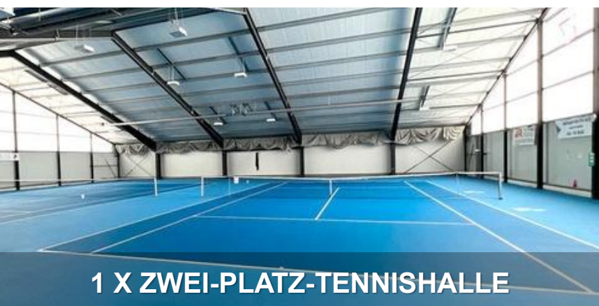
1 X ZWEI-PLATZ-TENNISHALLE