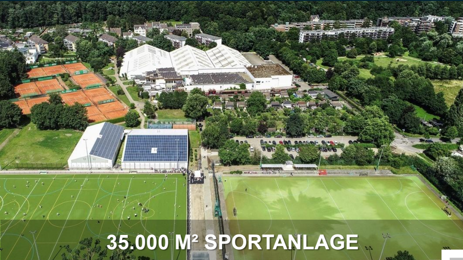
35.000 M 2 SPORTANLAGE