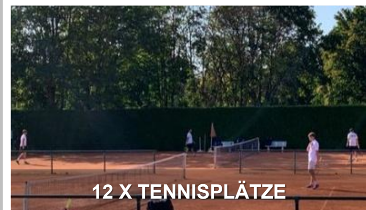
12 X TENNISPLÄTZE