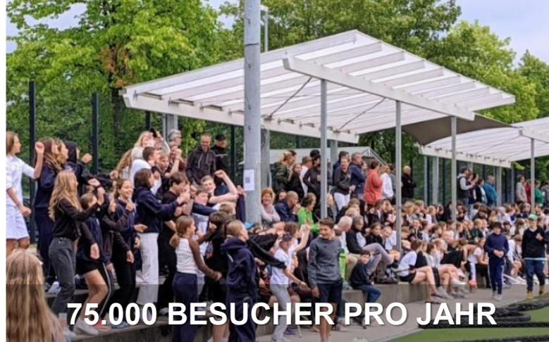
75.000 BESUCHER PRO JAHR