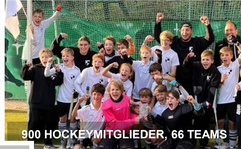
900 HOCKEYMITGLIEDER, 66 TEAMS